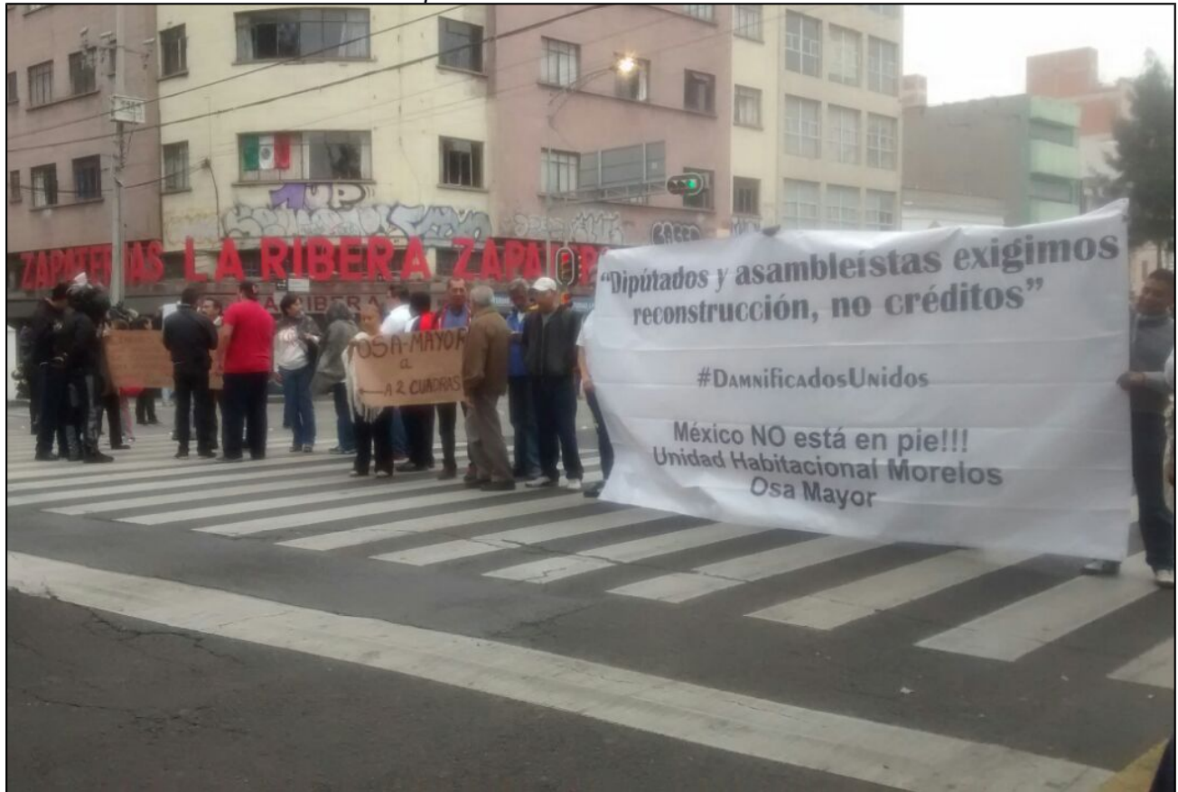
9 de noviembre de 2017, en la Delegación Cuauhtémoc.